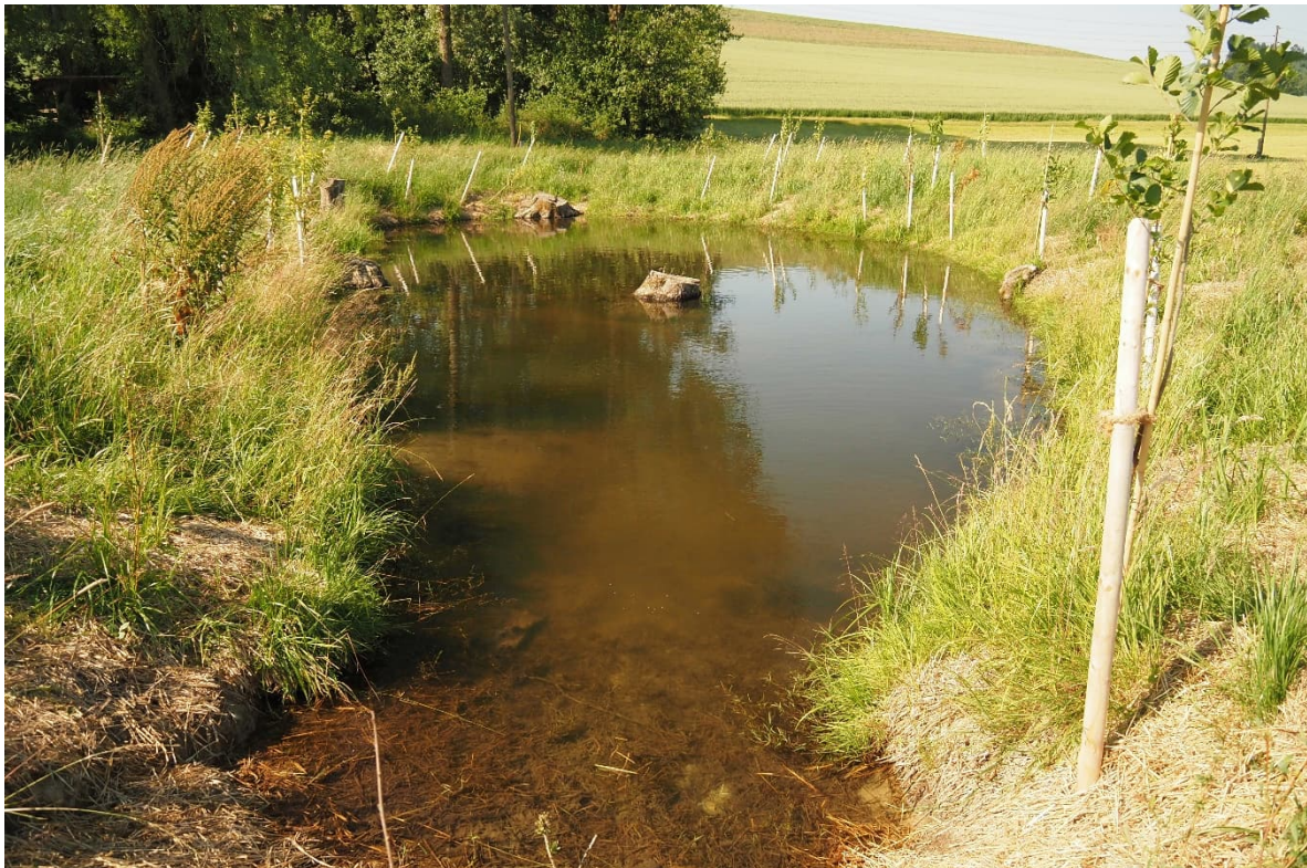
Foto: Renaturierung Ursprung, Gemeinde Eitzing